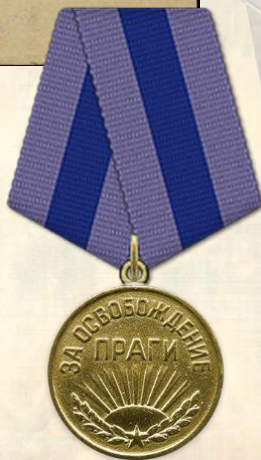
Наградной документ Медаль «За освобождение Праги» Дата документа: 09.06.1945